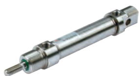
ISO 6432 roestvaststaal cilinder, diameters 16 tot 25 mm

ISO 6432 stainless steel cylinders, diameters from 16 to 25 mm