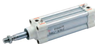
ISO 15552 cilinder type HCR, hoge corrosiebestendigheid, diameters 32 tot 125 mm

ISO 6432 stainless steel cylinders, diameters from 16 to 25 mm