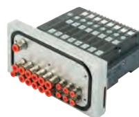
Ventieleiland voor spatwater omgeving. Serie HDM, 4 tot 16 ventielspoelen

Round stainless steel cylinders, diameters from 32 to 63 mm